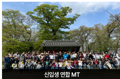
신입생 연합 MT